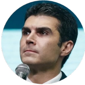
Hélder Barbalho Gobernador del Estado de Pará

Hélder Barbalho nació en Belém el 18 de mayo de 1979. Fue Ministro de Pesca y Acuicultura, Ministro Jefe de la Secretaría Nacional de Puertos y Ministro de Integración Nacional de Brasil. Es licenciado en Administración de Empresas por la Universidad de la Amazonia y posgraduado con un Executive MBA en Gestión Pública por la Fundação Getúlio Vargas.