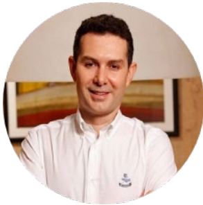
Jader Filho Ministro de Ciudades, Brasil

Jader Filho Jader Barbalho Filho tiene 47 años, es licenciado en Administración de Empresas por la Universidad de Amazonia, con especialización en Marketing y posgrado en Administración Pública por FGV. Como empresario, dirigió hasta 2022 el grupo de comunicación RBA, uno de los mayores del norte del país. Miembro del MDB desde 1995, es presidente estatal del partido en Pará. Fue elegido por el presidente Luiz Inácio Lula da Silva ministro de las Ciudades para dirigir uno de los principales programas del gobierno federal, Minha Casa Minha Vida. Es paranaense, está casado y tiene 5 hijos.