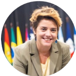
Hélinah Cardoso Moreira Directora, Pacto Mundial de Alcaldes para el Clima y la Energía en las Américas

En 2004, fue elegido para el cargo de alcalde de Ananindeua, habiendo asumido el cargo a la edad de 25 años, convirtiéndose en el alcalde más joven en la historia de Pará. Fue reelegido en 2008 y elegido gobernador del Estado de Pará en 2018.